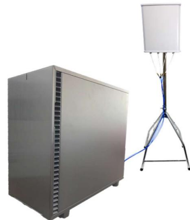
5Gコア一体型基地局